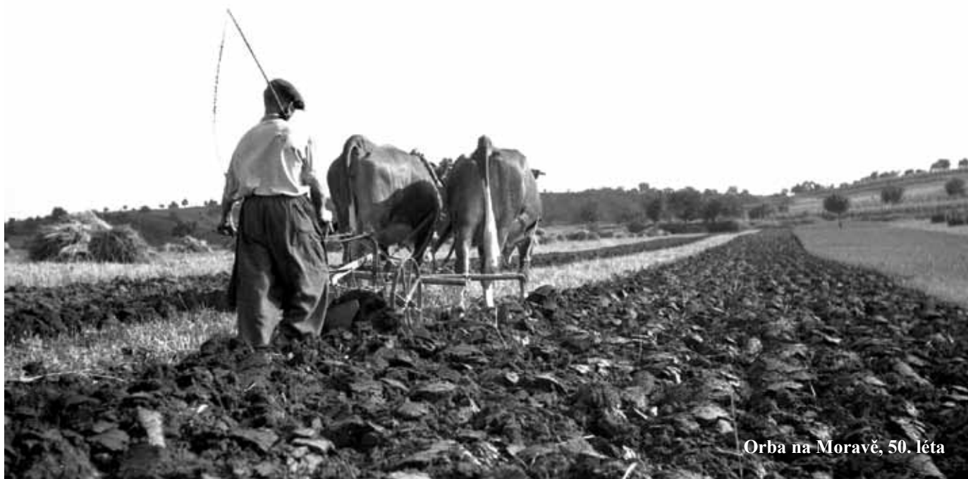
Orba na Moravě, 50. léta

Menší část výstavy Praha a lidé před 50 lety je v této době nainstalovaná mezi regály v moderně zařízené Husově knihovně v Praze 4 – Modřanech, Komořanská ul. 12. Zaměřená je především na spisovatele a další umělecké osobnosti 60. let, pochopitelně jsou tu i záběry z tehdejšího pouličního ruchu, dnes už neznámého, kdy se například dalo vyskakovat za jízdy z tramvají, stály se fronty u telefonních budek a poštu někde ještě vozil koňský povoz. Husova knihovna v Modřanech je otevřena přes celé prázdniny v pondělí od 11 do 18 h., ve středu od 9 do 17 h. a ve čtvrtek od 13 do 19 h. Dušan Veselý