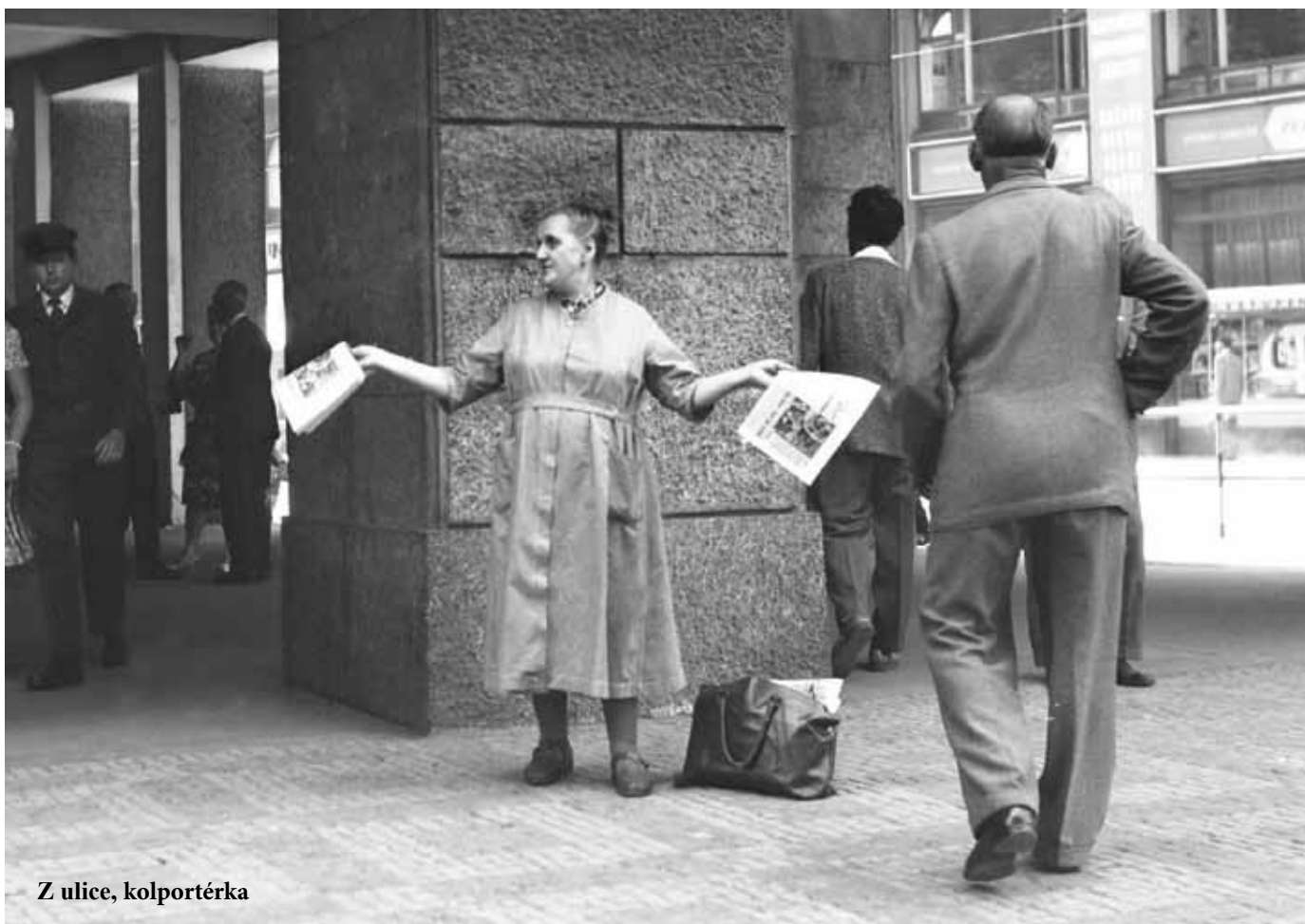
Z ulice, kolportérka