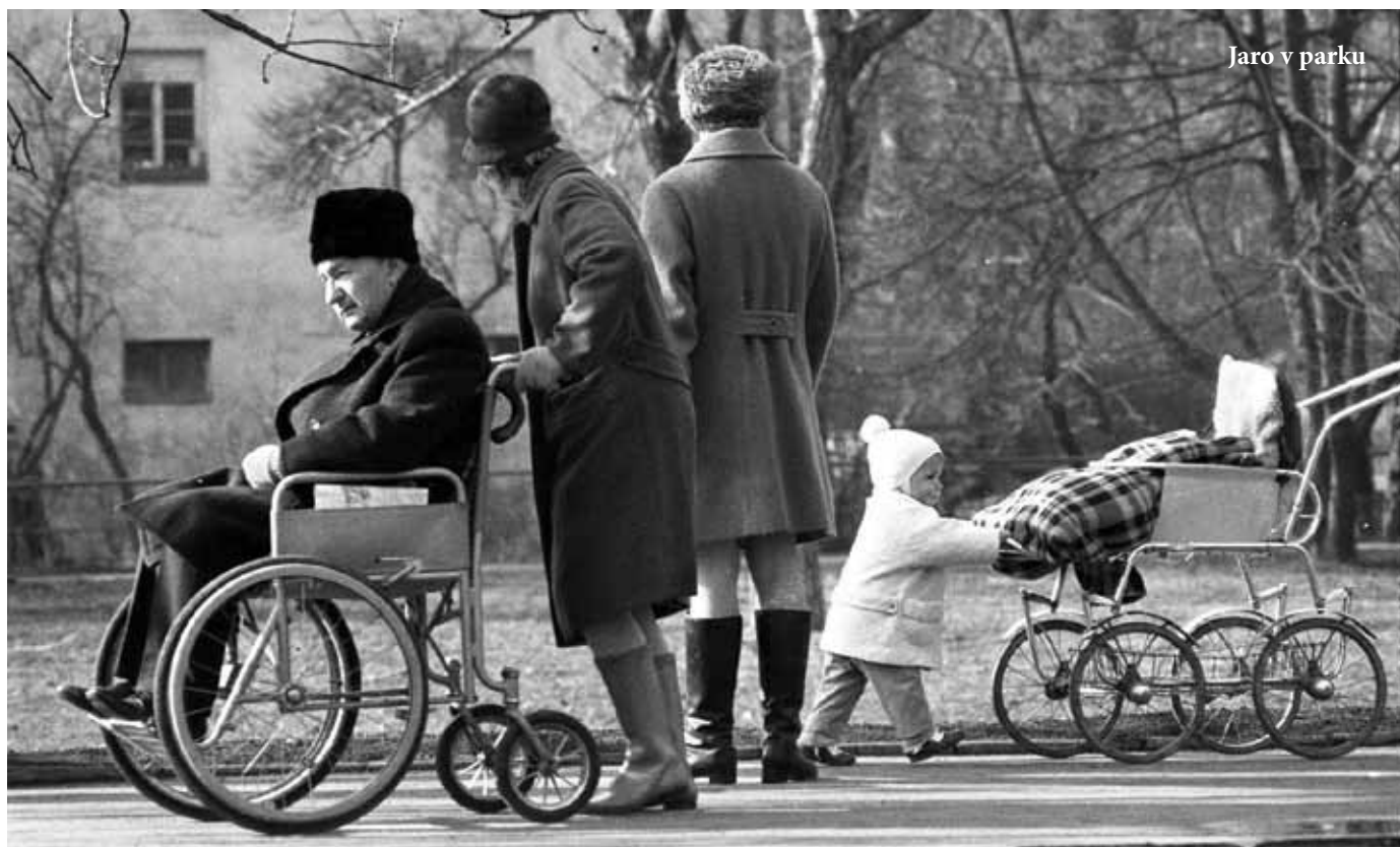
Jaro v parku