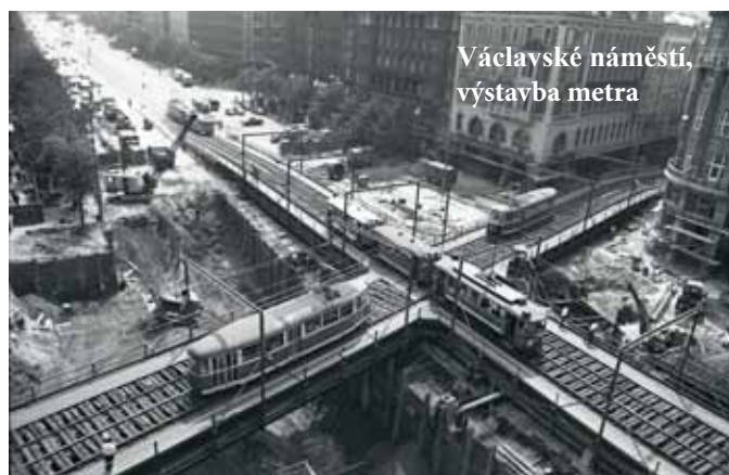
Václavské náměstí, výstavba metra